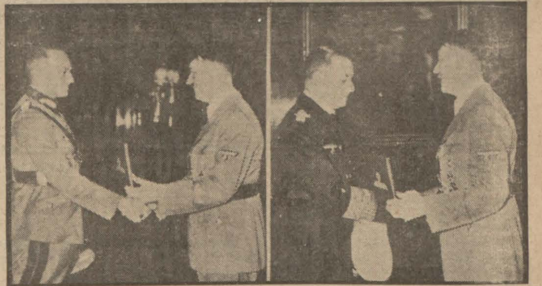
Hitler Leh harbinin neticelenmesi münasebetile Alman ordusu, başkumandanı ile donanma kumandanına nişan veriyor

Londra 11 (Hususî) — Bugün Londra'da, Sovyet Rusya ile İngiltere arasında ticaret anlaşması imza edilmiştir.