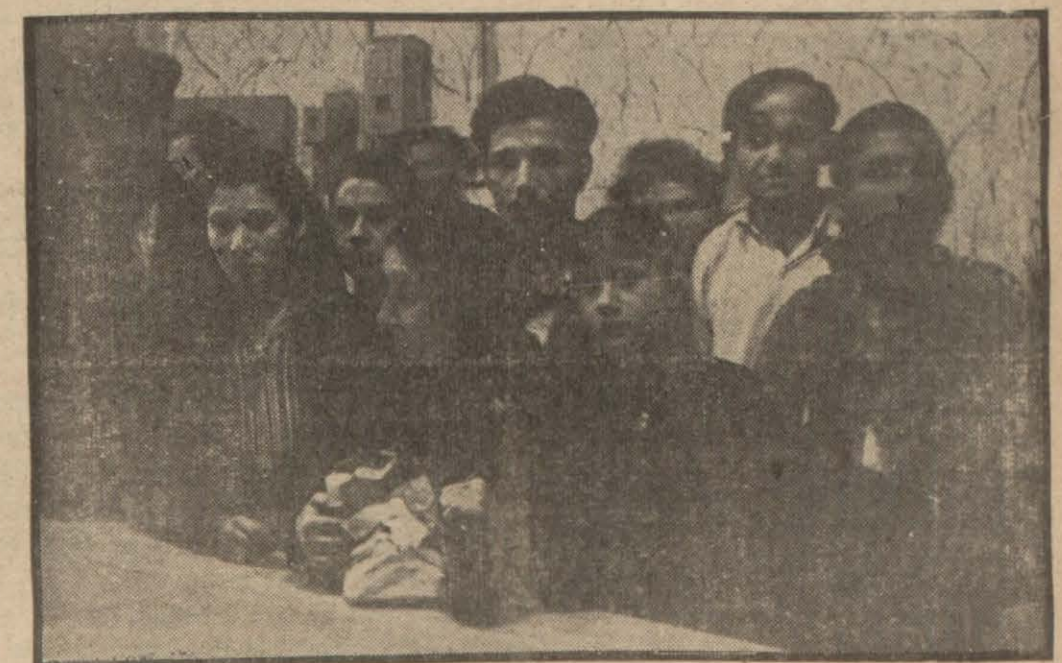
Fırınlarda ekmek çıkmasını bekleyen halk

Dün akşam üstü Beşiktaşta kısa süren bir ekmek buhranı başgöstermiştir. Bu semtte geç vakit bir fırın müstesna olmak üzere diğer üç fırının tezgâh ve vitrinlerinde bir tek ekmeğe tesadüf olunamamıştır. Fırıncılar, halkın lüzumsuz telâşi ve tesna olmak üzere diğer üç fırının tez-