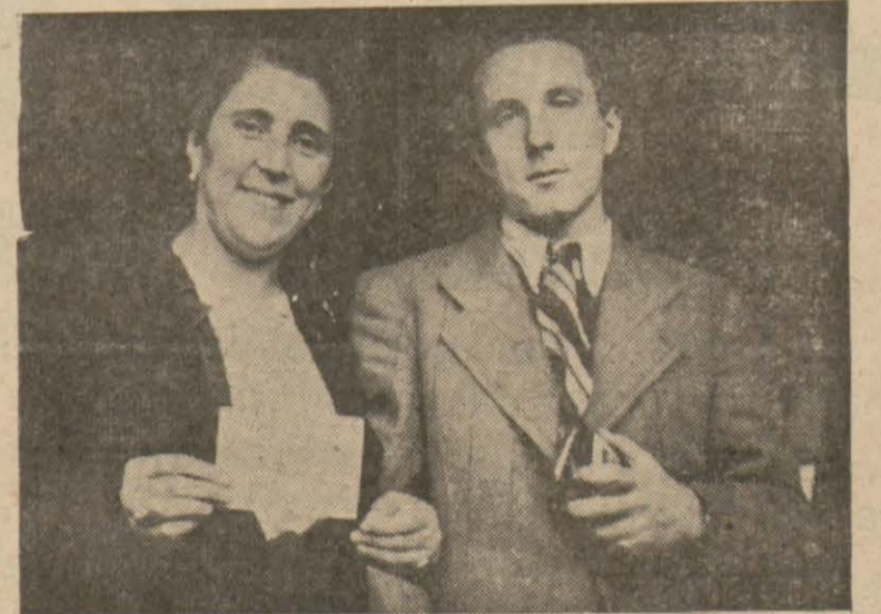
Büyük ikramiyeyi kazanan

3 üncü ikramiyeyi keza NİMET Ablanın uğurlu eliyle verdiği 9999 No. Bilet sahibi Bayazıtta Daltaban Yokuşunda 15 No. da Bayan Angeliki kazandı.