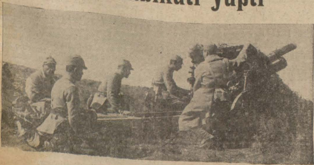
Dünkü atışlardan bir intiba (Yazısı 3 üncü sayfada)