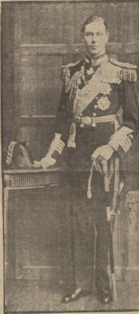
Majeste altıncı Corç

İngiltere Kralı dün askerî heyetimizin reisini kabul etti